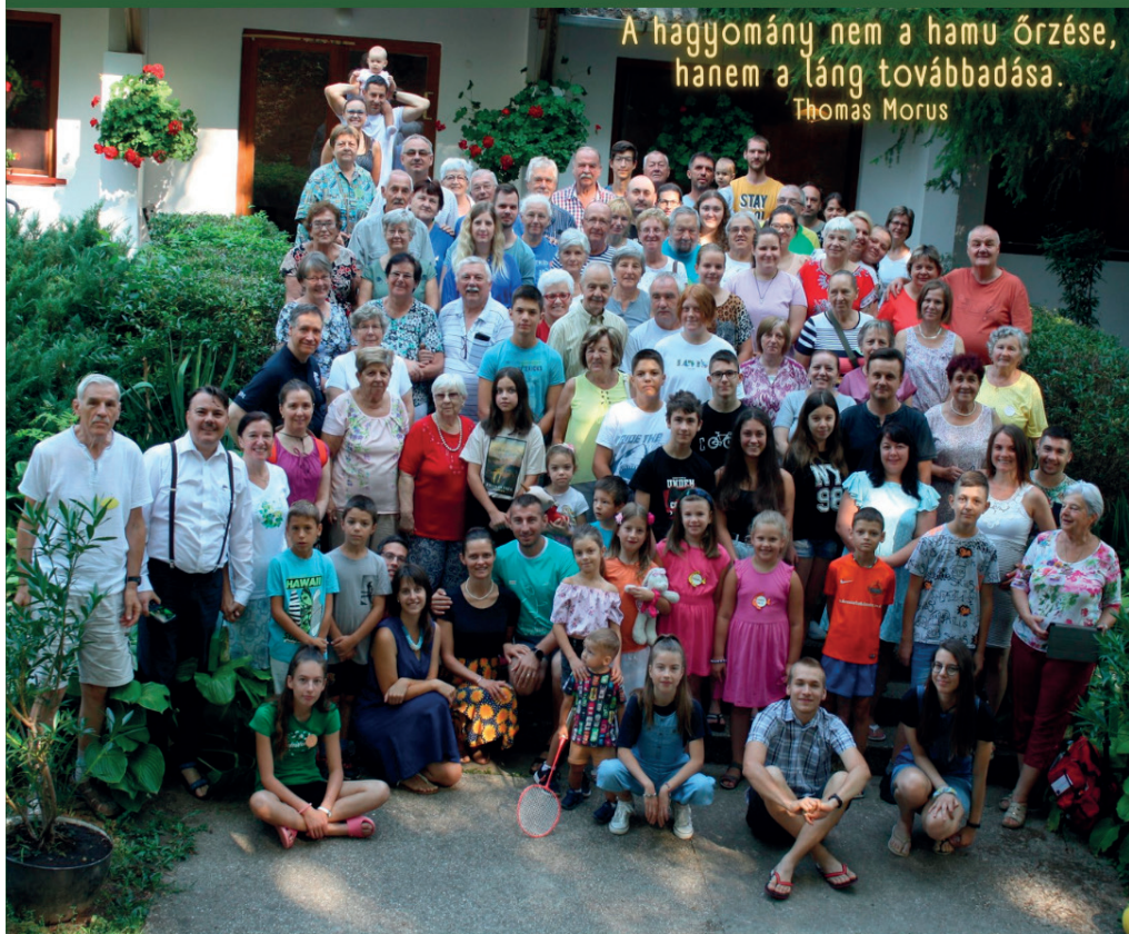
Tahi, gyülekezeti nagytábor

A hagyomány nem a hamu őrzése, hanem a láng továbbadása. Thomas Morus