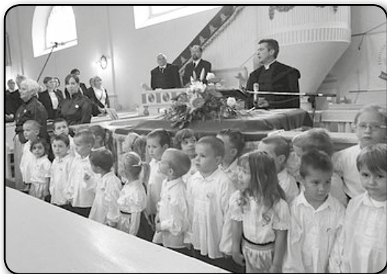
A Napsugár Református Óvoda növendékei az évnyitón