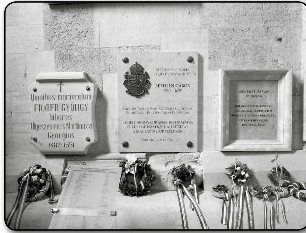
A mártír Martinuzzi Fráter György, valamint a református fejedelmek közül Bethlen Gábor és Bocskai István emléktáblája a gyulafehérvári székesegyházban