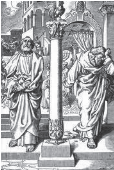
Péter és Judás.

„Minden jó ajándék és minden tökéletes adomány onnan fentről, a világosság Atyjától száll alá.” /Jak.1:17/