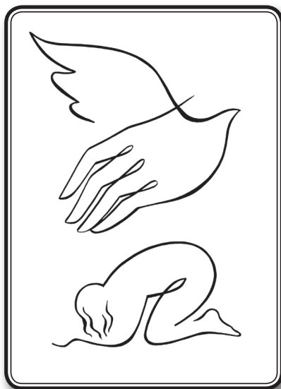
Simon András: Érintő kegyelem

Egyszer egy kisfiú nézett meg egy templomot az édesapjával. A templomnak sok szép üvegablaka volt, rajta színes bibliai alakokkal. A kisfiú egyszer csak megkérdezte: “Édesapa, kik azok a szentek?” Az apuka rövid gondolkodás után az ablakokra mutatott: “Látod, ők azok, akiket átsugárzik a fény!”